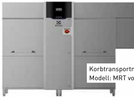
Korbtransportmaschine Modell: MRT von Electrolux