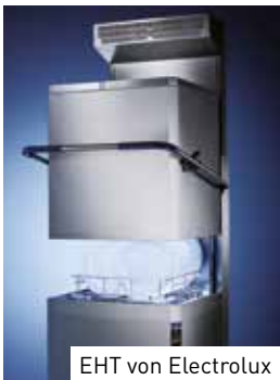
EHT von Electrolux