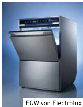
EGW von Electrolux